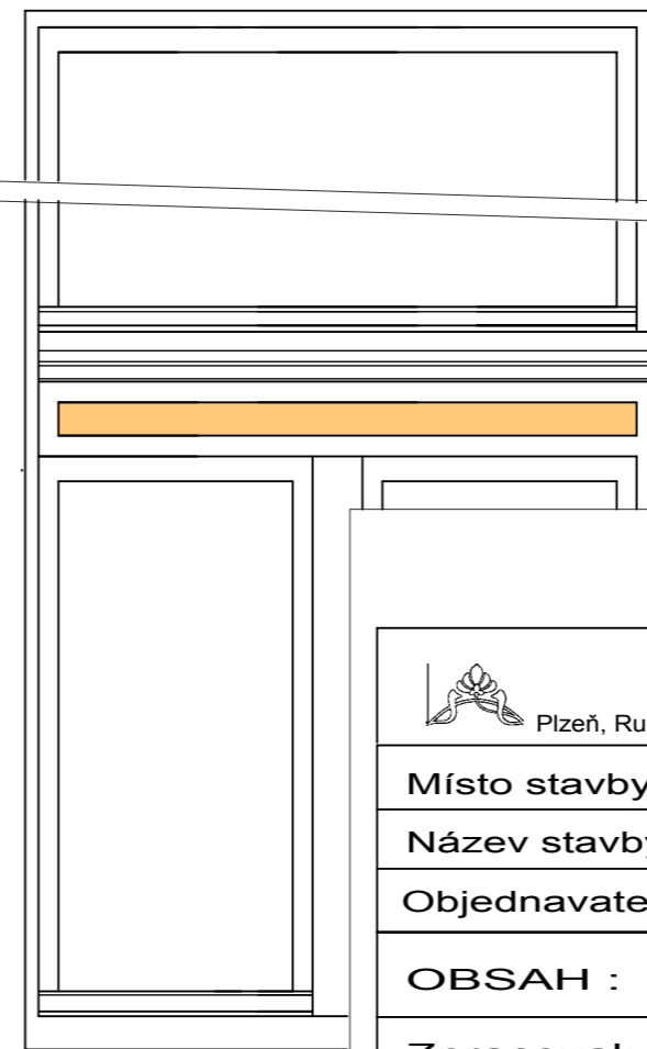
schéma provedení vlysů na vnějším okenním rámu